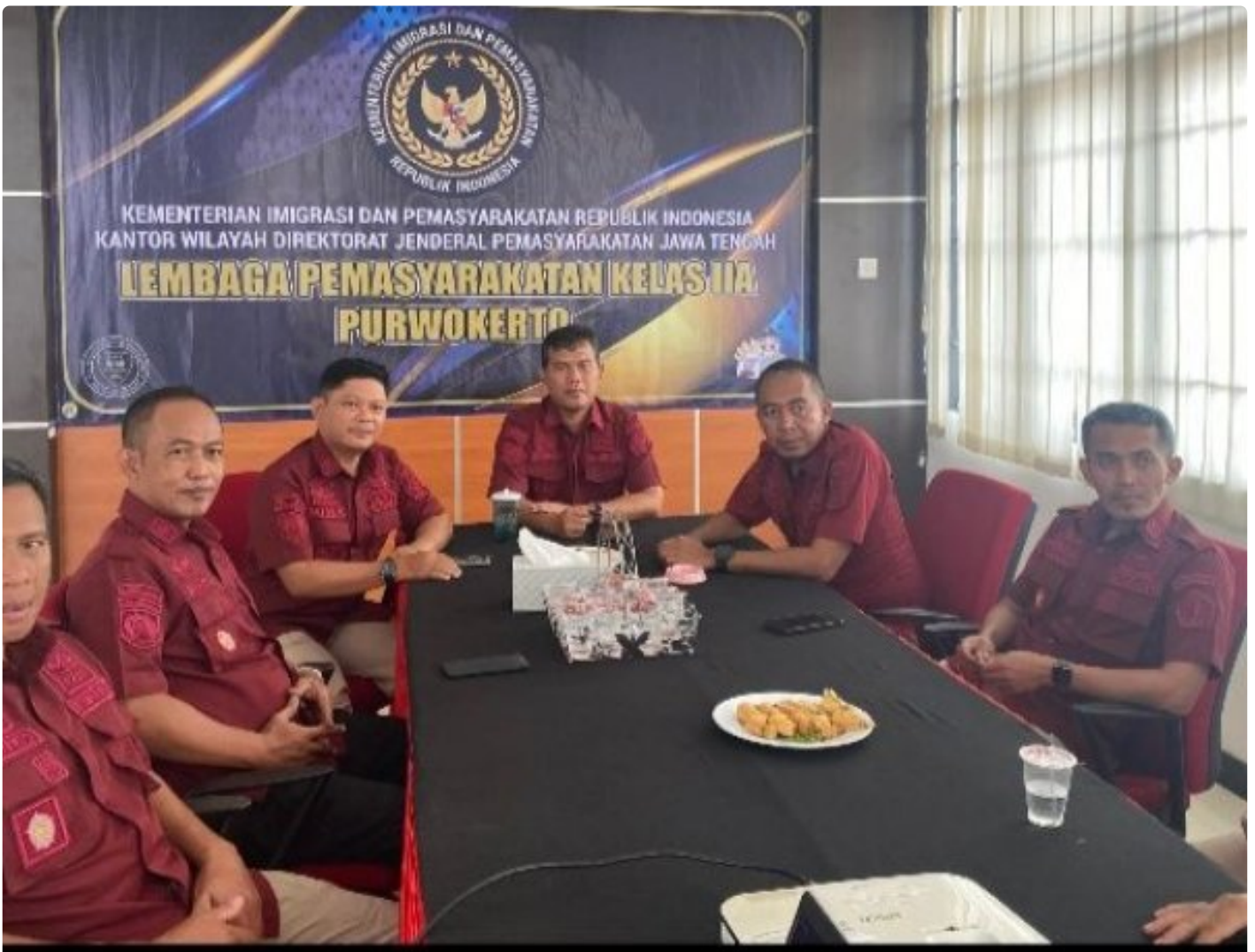
Lapas Purwokerto Ikuti Penguatan Kehumasan terkait Etika Penggunaan Media Sosial

PURWOKERTO Lembaga Pemasyarakatan (Lapas) Kelas IIA Purwokerto Mengikuti Secara Virtual Penguatan Kehumasan terkait Etika Penggunaan Media