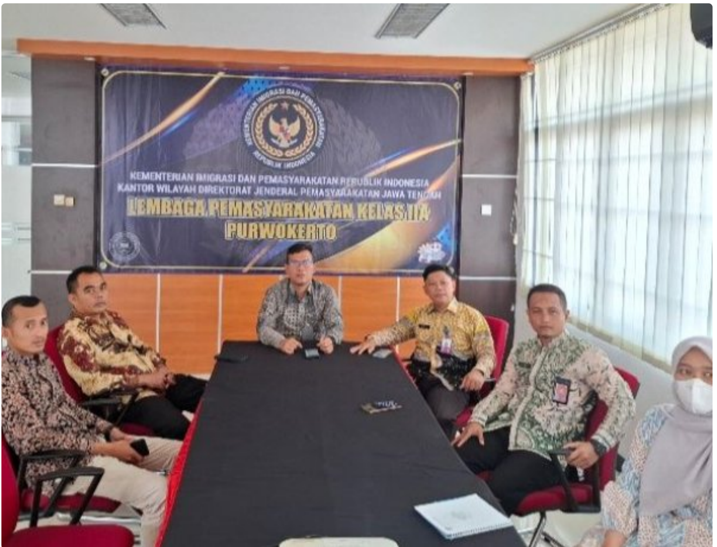
Lapas Kelas IIA Purwokerto Ikuti Entry Meeting Pemeriksaan BPK RI Atas Laporan Keuangan Kementerian Hukum dan HAM Tahun 2024 secara Virtual

PURWOKERTO - Lembaga Pemasyarakatan (Lapas) Kelas IIA Purwokerto